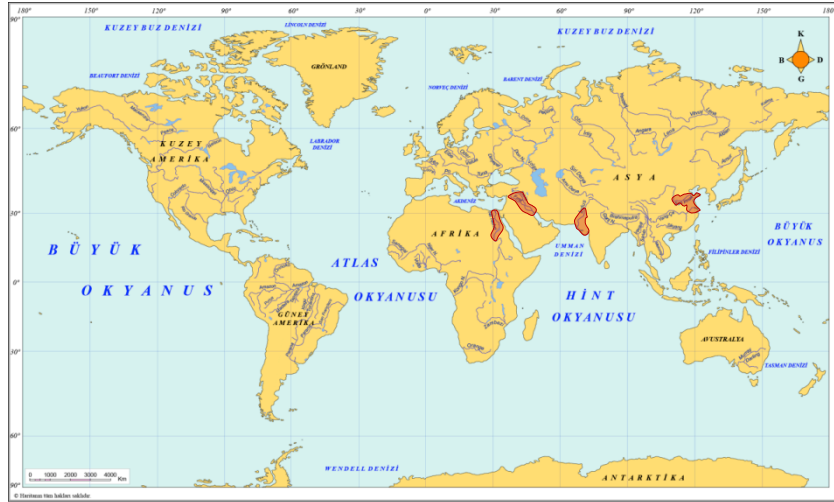
Harita-1: Dünya'daki akarsular 2 ve ilk kültür merkezleri

Eldeki bulgulara göre ilk medeniyetlerin geliştiği yer olarak kabul edilen Mezopotamya, Fırat ve Dicle nehirleri çevresinde kurulmuştur. Başlangıç ve gençlik evresi keşfedilmemiş olan Mısır Medeniyeti, Nil Nehri'nin çevresinde kurulmuştur ki zaten Herodot'a göre bu medeniyet Nil'in hediyesidir. Matematiğin, halkının genlerine işlediği Hint Medeniyeti, İndus Nehri çevresinde ve Çin Medeniyeti, Huang-ho Irmağı (Sarı Irmak) çevresinde kurulmuştur (Harita-1).